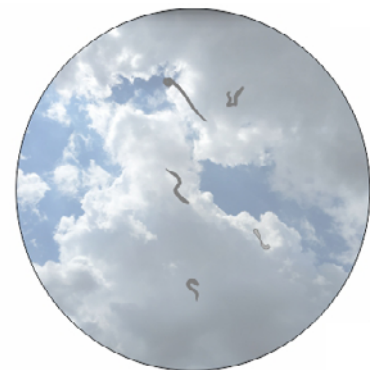
Flòculs vitris tal com els percep la persona