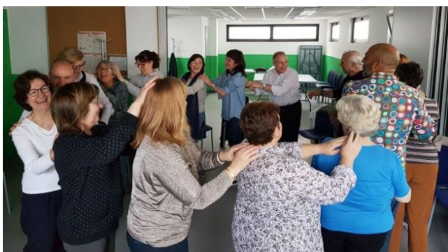
Figura 5. Classe de risoteràpia Formació Monogràfica 2017