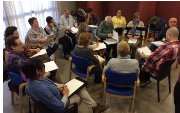
Figura 3. Dinàmica de role-playing de formació bàsica, 2015

El nombre d'alumnes pot variar entre 20-25 persones, essent reclutats des de les mateixes consultes dels professionals sanitaris, mitjançant una busca activa, i també poden ser reclutats publicitant el taller amb cartells informatius als EAPs i al barri. Prioritzem l'assistència de cuidadors primaris, amb sobrecàrrega i que no tinguin la persona cuidada institucionalitzada i d'aquesta manera s'aconsegueix una assistència força constant i elevada.