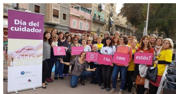
Figura 1. Celebració Dia Cuidador 2016

Una d'aquestes activitats és la celebració periòdica del "Dia del cuidador" (5 de Novembre) ( Figura 1 ), en la que realitzem activitats de conscienciació de la població sobre el rol del cuidador familiar, amb èxit de participació ciutadana. En l'edició del 2017 vàrem comptar amb l'ajuda dels estudiants de ESO de l'Institut Quatre Cantons de Barcelona.