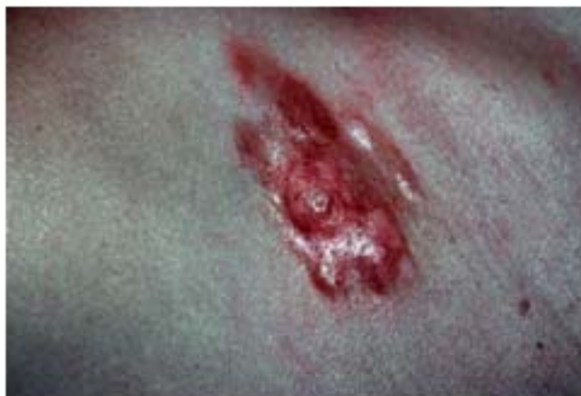
Figura 1: Dermatofibrosarcoma

Aparece de forma más frecuente en tronco y zona proximal de extremidades, 50-60% de los casos, el resto de los casos se suelen encontrar en extremidades 35%, y finalmente un 10-15% en la cabeza y el cuello 3 .