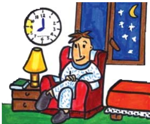
Espere 2-3h después de la cena para acostarse