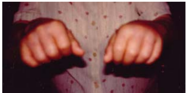
Figura 1. Tot i la deficient qualitat de la imatge, s'evidencia la manca de relleu dels nusos dels dits a conseqüència de l'intens edema, amb fòvea, present en el dors de les dues mans.

Malgrat els dubtes diagnòstics -perfectament raonables- vam iniciar tractament amb corticoides a dosis baixes (prednisona 10 mg/dia) obtenint una espectacular resposta clínica: desaparició dels edemes en el transcurs dels